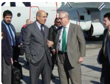
Группа экспертов ООН перед вылетом в Ирак