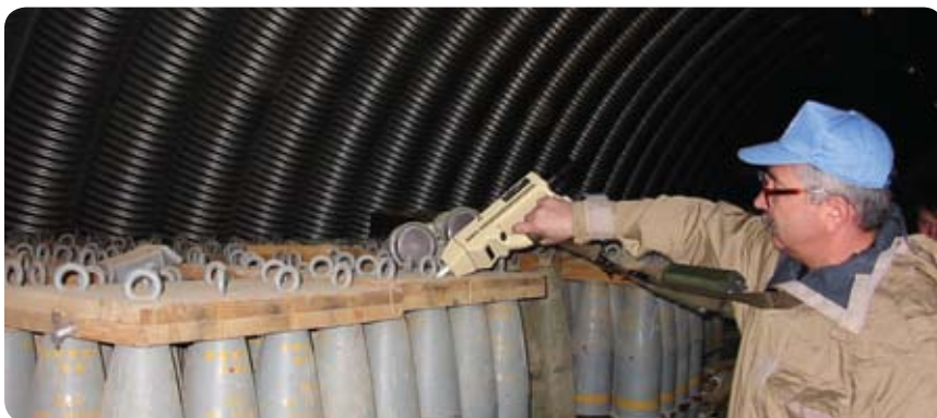
Работа на складе химических боеприпасов