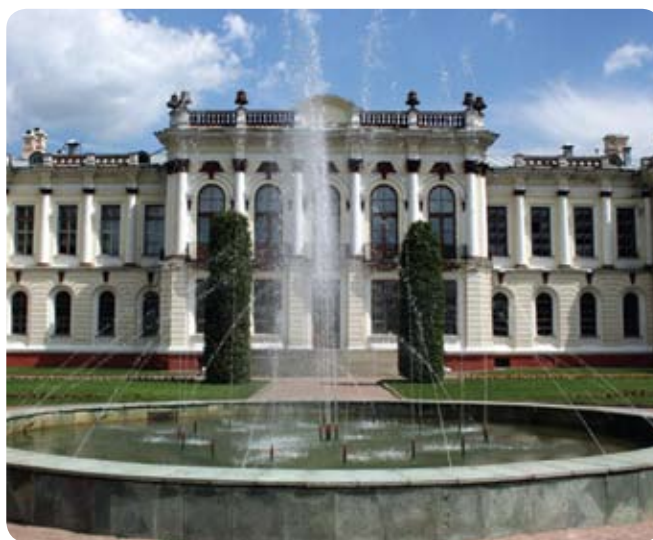
Российский государственный аграрный университет